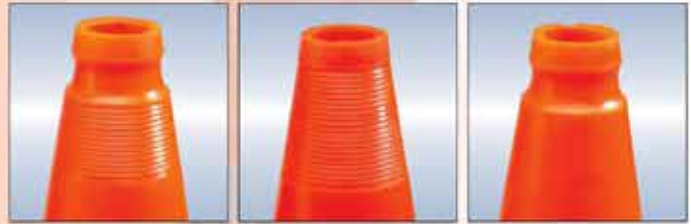
STRIES & GORGE Stries & groove Livraison standard

Pour une meilleure saisie de la balise dans toutes les conditions climatiques. Livrées en standard avec gorge et stries.