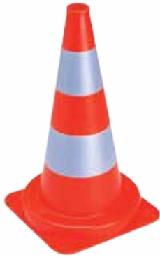
PVC ORANGE FLUO AVEC 2 BANDES FILM RETRO-RÉFLÉCHISSANTES Haute intensité scotchlite 3M