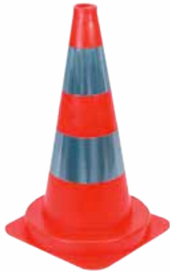
PVC ORANGE FLUO AVEC 2 BANDES FILM RETRO-RÉFLÉCHISSANTES PRISMATIQUES ANTI-PLUIE